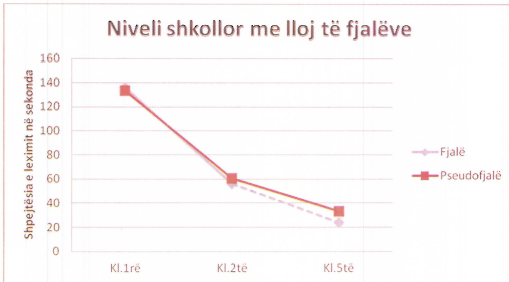
Figura 1. Shpejtësia e leximit sipas nivelit shkollor dhe llojit të fjalëve